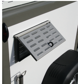
▪ Seitliche Lüftungsklappe