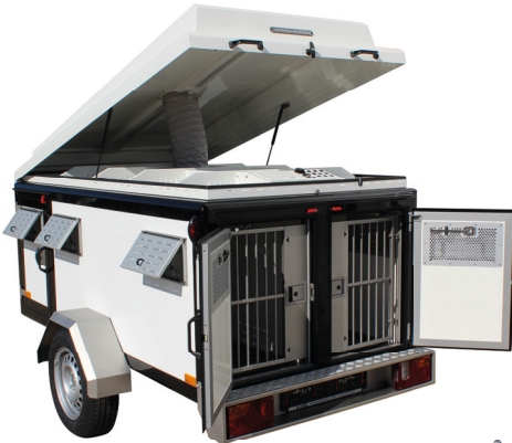
▪ DOG-Sport 4B-D, Heckansicht