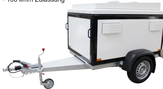
• DOG-Sport 3B-D