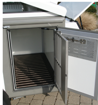
▪ Vordere Box mit Holzeinlegerost

Einmal ein DOG-Sport – immer ein DOG-Sport!