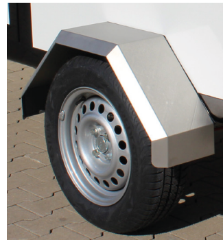
▪ Edelstahlkotflügel mit Verstärkung