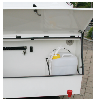
▪ Staukasten mit Wassertank