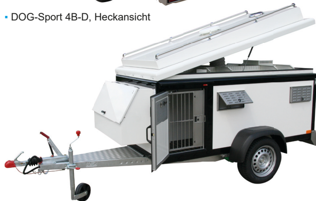
▪ DOG-Sport 4B-D mit Front-Staukasten