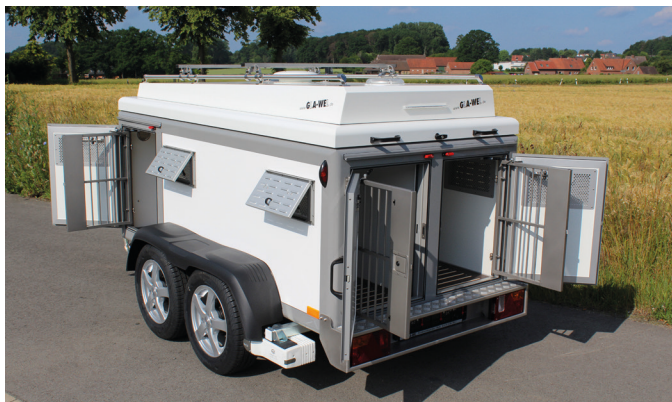
• DOG-Sport 4TB-D