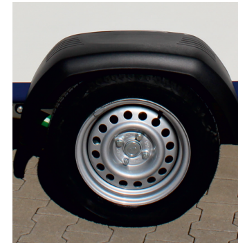
• Stahlfelge und Kunststoffotflügel