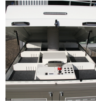
• Staudach mit Bedienkonsole