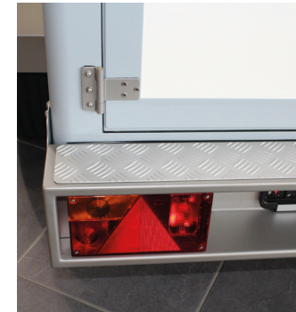
• Rücklicht in Edelstahlstoßstange